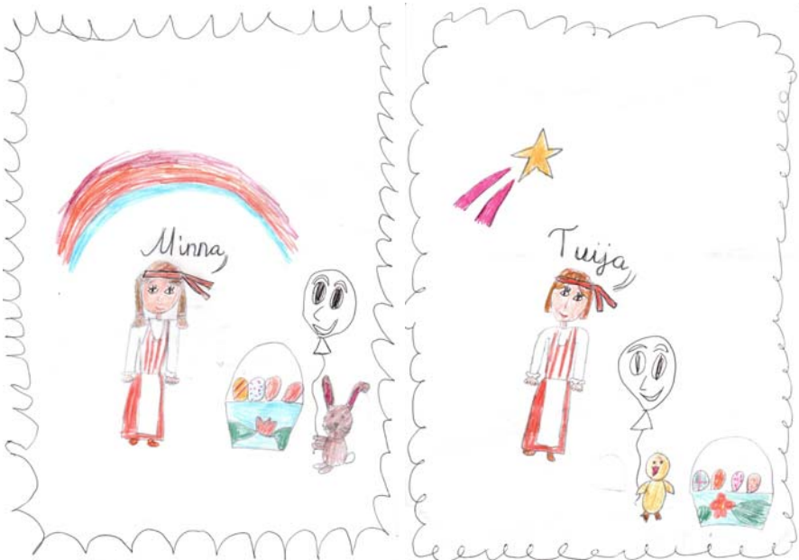
Kuvat ohjaajista piirsi Heisi.