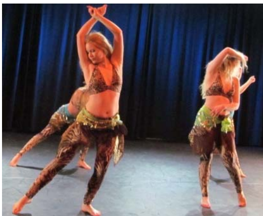
Toisenlaista etnistä menoa