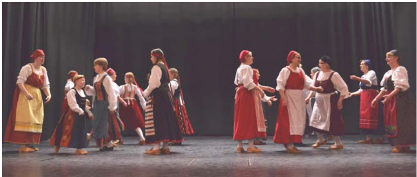
Nuoret ja aikuiset tanssivat kilpaa Skottienia