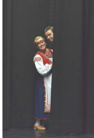
Ja se pilkistys