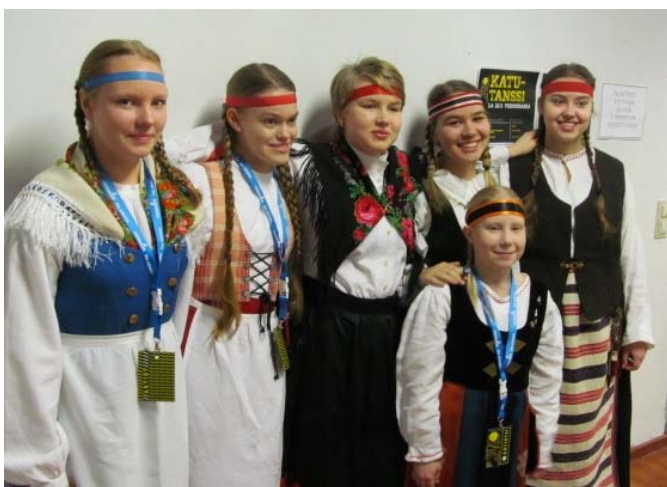
Koko jengi valmiina esitykseen

Ja kyllä sitä kelpasi katsoa. Tytöt esittivät tanssit Hempu, Kuudenkolmeinen, Polkkakättönen ja Jagujalka. (Tosin rento juontajanuorukainen luki tuon yhden tanssin nimeksi ihan epäroimättä ”Palkka-