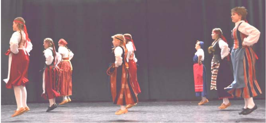
Nuorten ryhmän Folkjamia