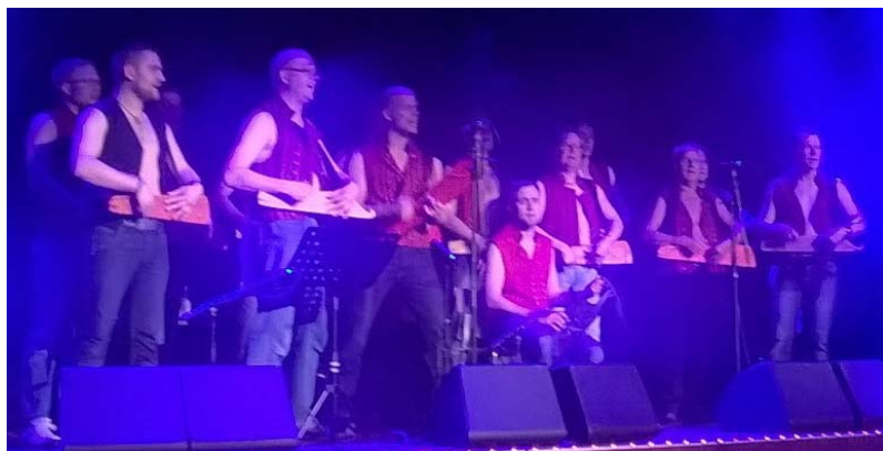
Äijäkanteleet sai huiman suosion.

Virolaisen Koidupunan esitys oli vauhdikasta ja perinteistä kansan-