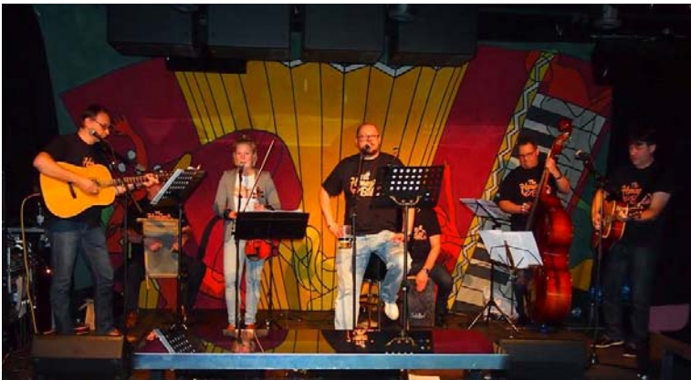
The Honey Balls viihdytti letkeällä soinnillaan

Ensisävelistä lähtien musiikki tuntui kotoisan letkeältä. Kitarat, basso, pyykkilauta, viulu ja jokin lyömäsoitin taustalla – koko rum-