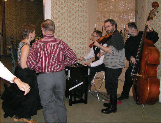
Tanssia Spelarien tahdittamana.

Loppuillasta tanssitiin ja hurrattiin paikalla olleiden puheenjohtajien, entisten ja nykyisen, ympärillä. Nämä ovat seuraa luotsanneet läpi vuosien. Joku