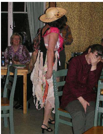
Liivihame sai monet hymyilemään, jopa nauramaan