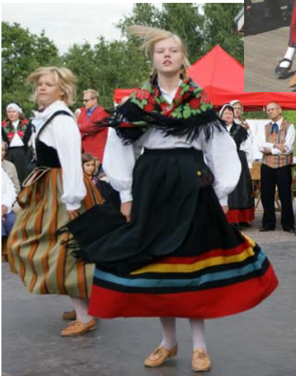
Nuorta vauhtia Myllyillassa Helsingin pitäjän myllyllä 6.8.08