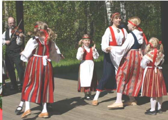
Nuoret Tomtebon lavalla Seurasaaren lastentanssuissa 25.5.08