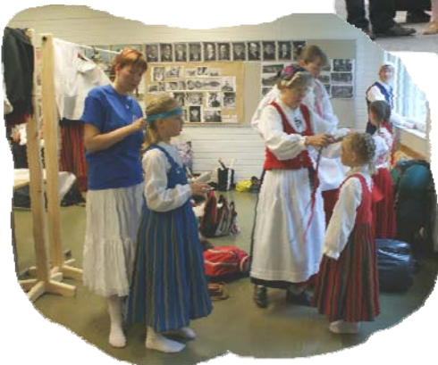
Tukat letille ja puvut päälle pääjuhlaan.