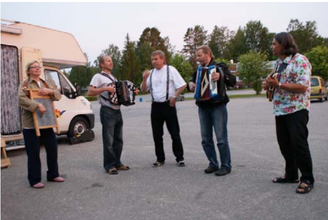
”Raijan bändin” jatkosoitot koulun pihalla lauantai-yönä.