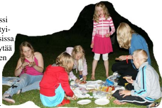
Yöpiknikillä meren rannalla