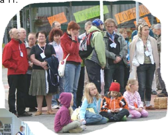
Spelareita Pihkurin Pyörähdyksen avajaisissa Viitasaaren torilla.