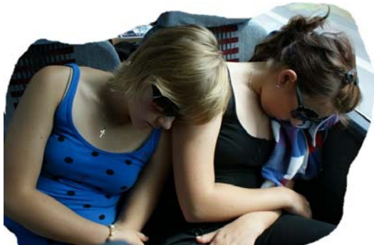
Myös Ruotsin maisemat ihastuttivat matkajia!