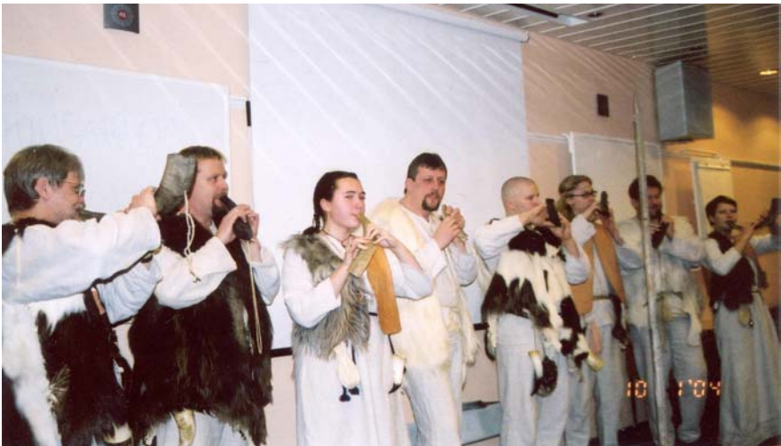
Sarvi soi. Pukinsarventröötöttäjät levyään julkistamassa Folklandia risteilyllä

Kurssilaisista ne, jotka onnistuivat saamaan säällisiä ääniä sarvistaan, pääsivät orkesteriin. Ja siitä alkoi tämän erikoislaatuisten yhtyeen taival. Toisena