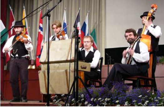
Spelarit soittamassa Sakala-keskuksessa