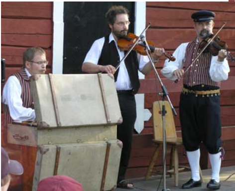
Myllyiltaa tahdittivat Spelari-soittajat.

Helsingin pitäjän myllyllä vietetään Myllyiltaa kesäkeskiiviikkoisin. Perinteiseen tapaan seuramme esiintyy Myllyillassa heinä-elokuun vaihteessa, tänä kesänä 4.8. Tarkkasilmäiset lukijat voivat huomata, että tässä on kyseessä vielä harjoitus, koska kaikkien tanssijoiden puvustus ei ole vielä läheskään kunnossa.