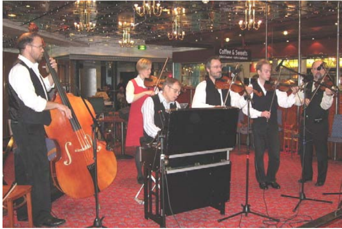
Spelarit Food Marketin esiintymisessä.

Viimeinen konsertti kuuden konsertin sarjasta, josta siis neljä kävin katsomassa, oli "Suomi Neidon Salaiset Arkistot". Ensimmäinen esitys olisi kuulunut pikemminkin joukkoon oudot tanssit, sillä niin erikoinen esitys se oli. Yksi mies soitti haitaria, toinen lauloi möreällä äänellä ja kolmas tanssi matkalaukun kanssa tunkien välillä puukkoja suuhunsa... Esitys oli todennäköisesti liian taiteellinen, jotta