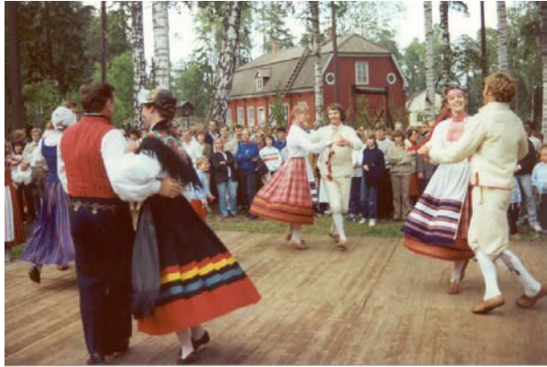
Spelarit ja aikuisryhmän tanssijat Antintalon edustalla juhannuksena 25.6.1982