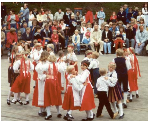
Tanhukat ryhmä Seurasaaren juhlakentällä Lasten tanstuissa 2.6.1983.