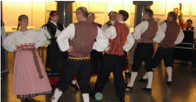
Riitan ryhmä esiintymässä Seurasaari-näyttelyssä Jugend-salissa 7.1.2007

Oikeat vastaukset lastensivujen tehtäviin: 2. Lumiuikko, lumilyhyt, lumihivonen, mäenlasku, hiihto 3. varis, allit, ruokki, tavi, kana, kuningaskalastaja, tikka, rastas, käki, täinen 4. mustikka, mansikka, puolukka, karpalo, mesimarja, vadelma 5. Ulkona on ihana ilma. Siis ota esiin sukset tai luistimet ja mene ulos liikkumaan! Hauskaa ulkoilua!