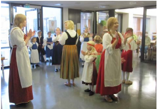
Myyrmäen palvelutalossa 6.10.09