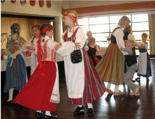
Esitys Kanneljärvi- säätiön juhlassa Kar- jalatalolla 11.10.09