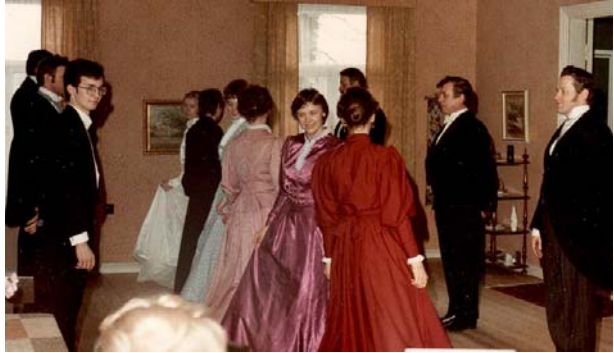
Helsinge fransäs in filmmaustilaisuudesta 1983.

Helsinge fransäs esitettiin 6 parilla suurelle yleisölle juhlavissa puitteissa keväällä 1983 Finlandia-